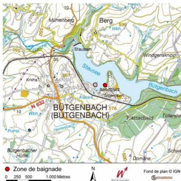
Figure 1: localisation précise de la zone de baignade F26 sur fond de plan IGN©. L'ancienne zone (F02) correspond au rond gris et la nouvelle au rond rouge.

La nature du fond est assez homogène et se caractérise par la présence de sable et de vase. La berge de la zone de baignade F26 est de type "engazonnée" et se termine par une plage de sable donnant un accès direct à la zone de baignade.