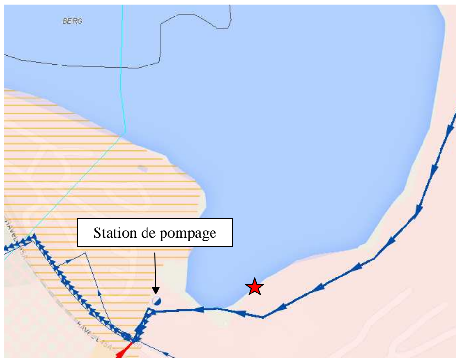
Figure 4: localisation de la station de pompage située à proximité de la zone de baignade F26.

Cependant, la présence d'une station de pompage à proximité de la nouvelle zone de baignade pourrait s'avérer à risque pour les utilisateurs du site en cas de fortes pluies, d'orages ou de débits exceptionnels (figure n°4).