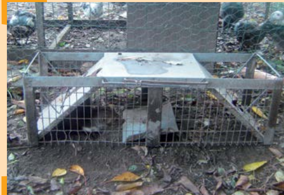
Boîte à fauve

régulation des animaux nuisibles (entreprises de dératisation...) et qui parfois étendent leurs services au piégeage des fouines.