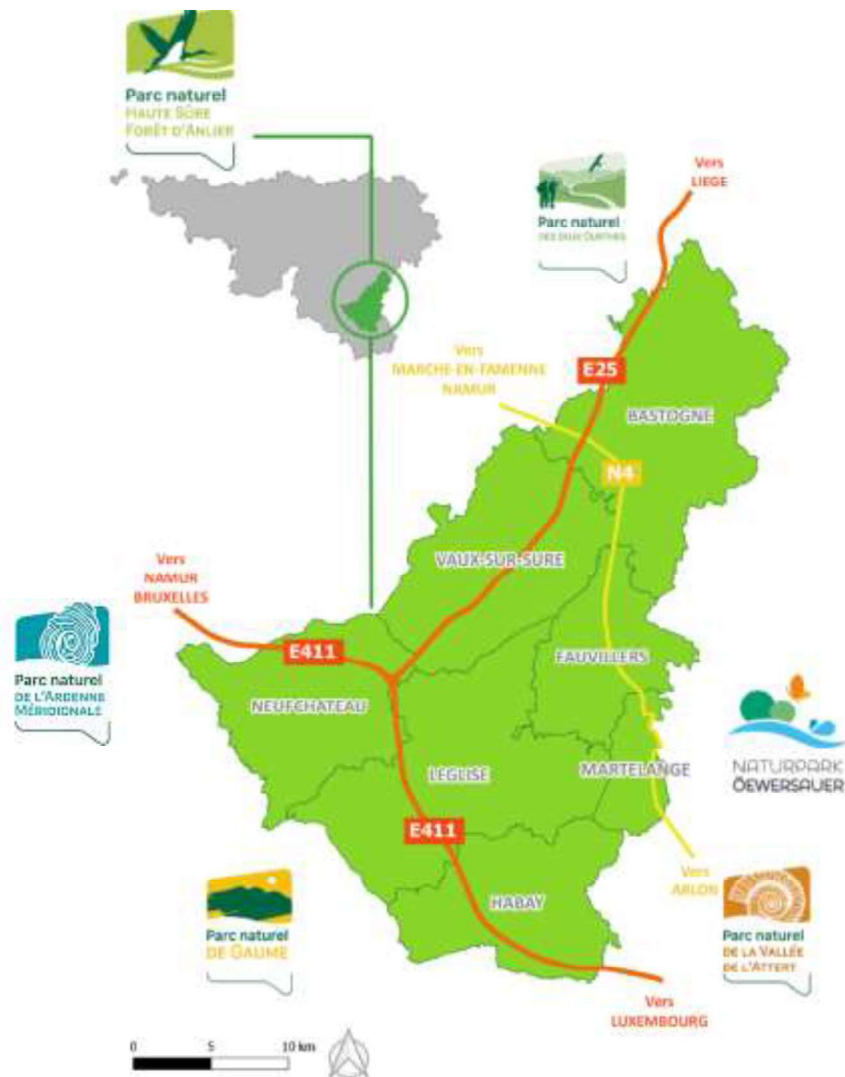
Fig. 1- Le Parc naturel Haute-Sûre Forêt d'Anlier

Le Parc naturel s'étend sur 80.200 ha, correspondant aux territoires des sept communes qui le composent, à savoir : Bastogne, Fauvillers, Habay, Léglise, Neufchâteau, Martelange et Vaux-sur-Sûre. De caractère essentiellement rural et de faible densité de population, la ville de Bastogne constitue l'entité la plus peuplée.