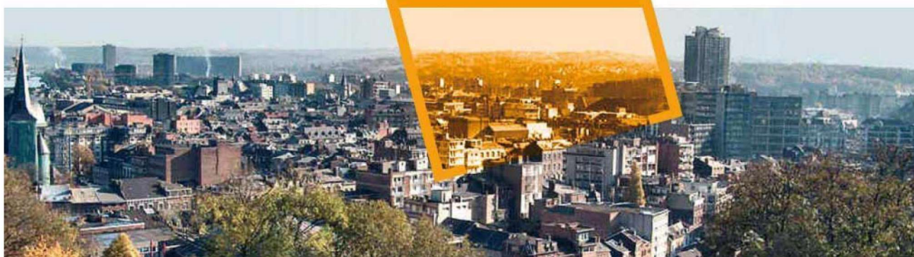
SCHÉMA COMMUNAL DE DÉVELOPPEMENT COMMERCIAL