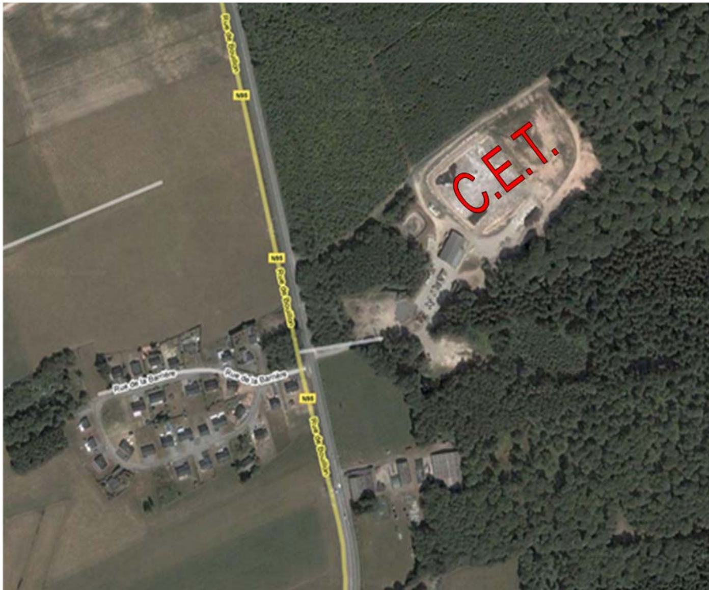
Figure 1 : vue aérienne du C.E.T. de Malvoisin

Sur la carte topographique IGN, le site est situé dans le coin inférieur gauche de la planche 58-8 (Vencimont). Immédiatement à l'est, on est sur la planche 59-5 (Pondrôme), au sud-ouest, sur la 63-4 (Gedinne) et au sud-est sur la 64-1 (Haut-Fays).